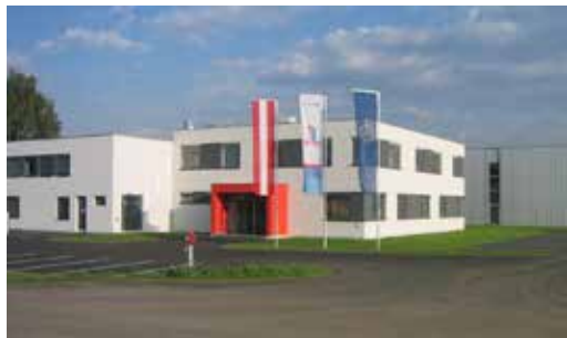
Zentrale in Kaindorf/Sulm

ELSTA Mosdorfer GmbH entwickelt und fertigt Schrank- und Gehäusesysteme für technische Anwendungen in der Energieverteilung, Telekommunikation, Verkehrstechnik und Industrie. Kernkompetenz dabei ist die Verarbeitung von heißverpressten, glasfaserverstärkten Verbundwerkstoffen sowie die Projektierung und der elektrotechnische Ausbau von fabriksfertigen Schaltgerätekombinationen. Mit mehr als 40 Jahren Erfahrung auf diesem Gebiet zählt ELSTA Mosdorfer heute zu den international führenden Anbietern.