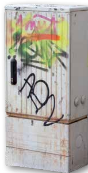
Ausschnitt aus einem Foto von Alexandra Gschiel, das im Rahmen des Projekts „KONZENTRAT: Doppel L“ von Markus Wiffling veröffentlicht wurde.