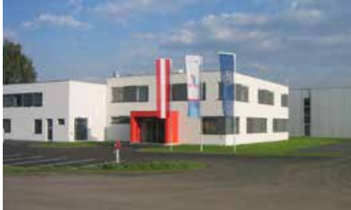
Zentrale in Kaindorf/Sulm

ELSTA Mosdorfer GmbH entwickelt und fertigt Schrank- und Gehäusesysteme für technische Anwendungen in der Energieverteilung, Telekommunikation, Verkehrstechnik und Industrie. Kernkompetenz dabei ist die Verarbeitung von heißverpressten, glasfaserverstärkten Verbundwerkstoffen sowie die Projektierung und der elektrotechnische Ausbau von fabriksfertigen Schaltgerätekombinationen. Mit mehr als 40 Jahren Erfahrung auf diesem Gebiet zählt ELSTA Mosdorfer heute zu den international führenden Anbietern.